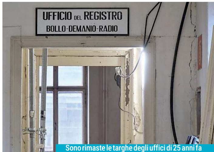
Sono rimaste le targhe degli uffici di 25 anni fa