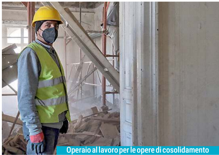
Operaio al lavoro per le opere di consolidamento