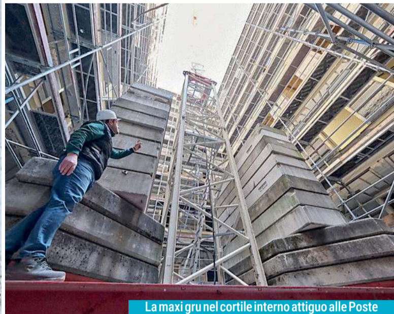
La maxi gru nel cortile interno attiguo alle Poste