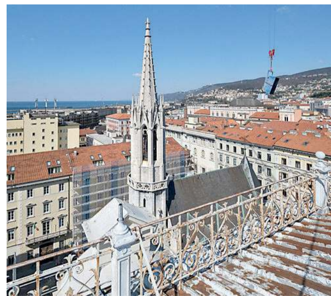
La vista dal terrazzo sulla chiesa luterana e la benna della gru al lavoro

Le residenze private hanno metrature diverse: dal monolocale al trilocale con due