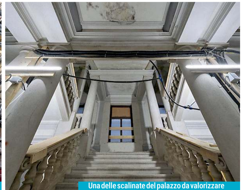
Una delle scalinate del palazzo da valorizzare