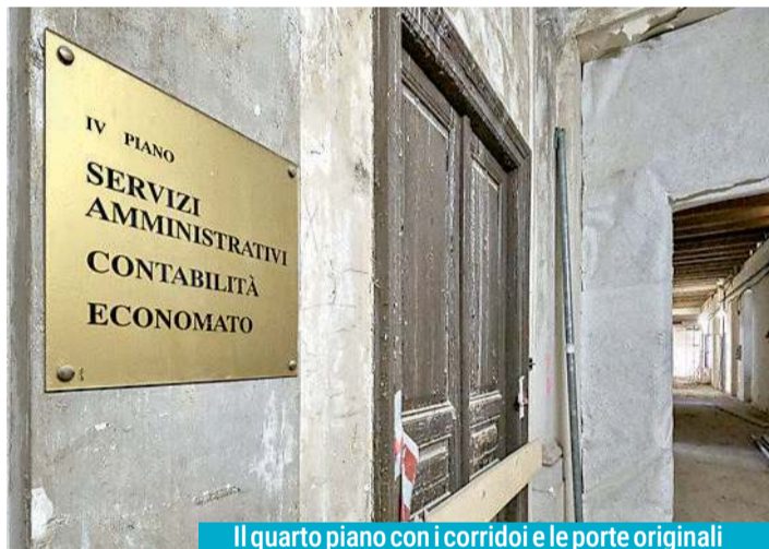
Il quarto piano con i corridoi e le porte originali